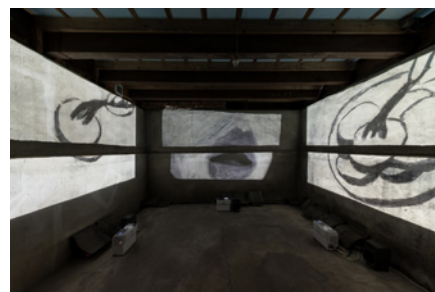
「街頭演説室」2025年

美術家・映像作家。東京藝術大学大学院映像研究科修了。もどかしい身体、環境の揺らぎといったことを側に置き、映像、ドローイング、インスタレーションを往還しながら制作する。主な展示にゲーテインスティテュート主催「ひとり(ぼっち)」や、六本木アートナイト2025など。また、Festival of Animation Berlin でのメインビジュアル・展示・WS・キュレーションや、Hermèsとのコラボレーション等、国内外で様々な発表。