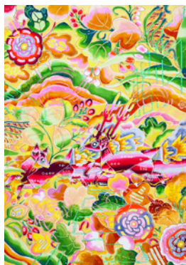
「黄土色地草花禽獣文様」

主な個展に Sokyo Atsumi (東京/2024)、主なグループ展に「札幌国際芸術祭2024」(北海道近代美術館/札幌/2024)、「JAPAN: Myths to Manga」(Young Victoria and Albert Museum/ロンドン/2024)。また東京藝術大学美術館、北海道近代美術館、Morikami Museum (マイアミ)、Victoria and Albert Museum (ロンドン)に作品が収蔵されている。