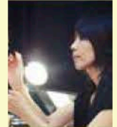
● ヘアメイク 鈴木節子