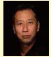
● スチールカメラ ZIGEN