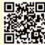
「こどもファッションプロジェクト」 公式サイト