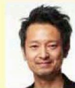
● ヘアメイク 原田忠