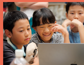
※2025年度プログラムの様子