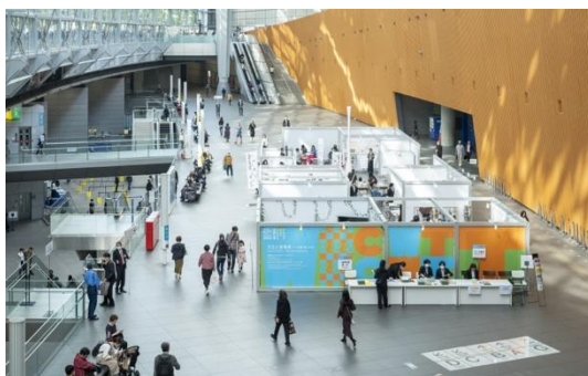
※「だれもが文化でつながる国際会議2024」の様子