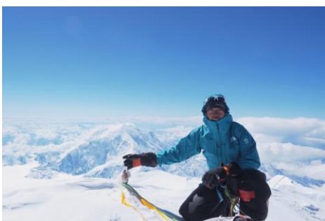
2026年6月アラスカ・デナリ山頂にて。