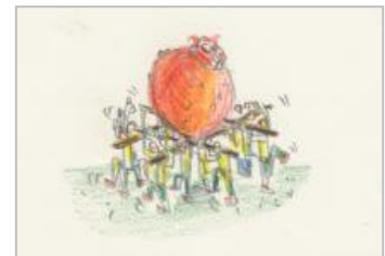
「みこし」のイメージ画