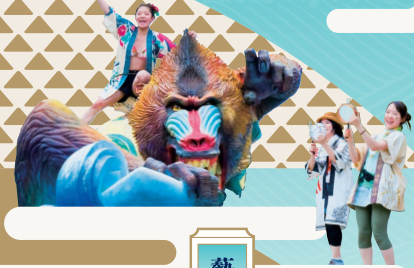
藝大サンバーティ