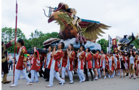
写真(左上)……昨年の偶田川夕日見の様子(左下)……藝祭みこし(今年の藝祭より)