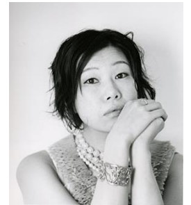
羊屋白玉