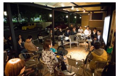
「desart & dessert vol.8」