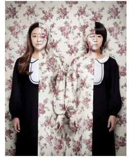
アートディレクション：吉田ユニ

【期間】10月24日（金）～10月31日（金） 【会場】東京芸術劇場 プレイハウス