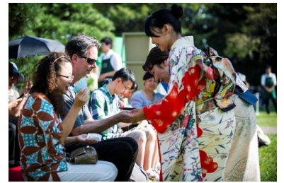
東京大茶会 2013 浜離宮恩賜庭園 イングリッシュ野点

茶道に馴染みのない方や海外の方々に、「お茶の文化」や「茶の湯」を気軽に楽しんでいただく大規模な茶会。美しい庭園や由緒ある建物の中で本格的な茶席や野点のほか、初心者向けの茶道教室「茶道はじめて体験」や「子供のための茶道教室」（江戸東京たてもの園）、外国人向けの「イングリッシュ野点」（浜離宮恩賜庭園）、高校生がお茶を振る舞う「高校生野点」（浜離宮恩賜庭園）などを実施します。