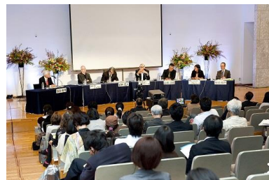
「文化の力・東京会議2013」の様子

東京文化の国際発信と国際ネットワークの強化を目指し、「文化の力・東京会議2014」を開催します。4回目となる今年は、東京・ベルリン友好都市提携20周年記念事業と位置づけ、ベルリンのほか、ロンドン、ソウル、日本各都市から専門家を招き基調講演やパネルディスカッションを通して文化創造都市とフェスティバルのあり方について考えます。