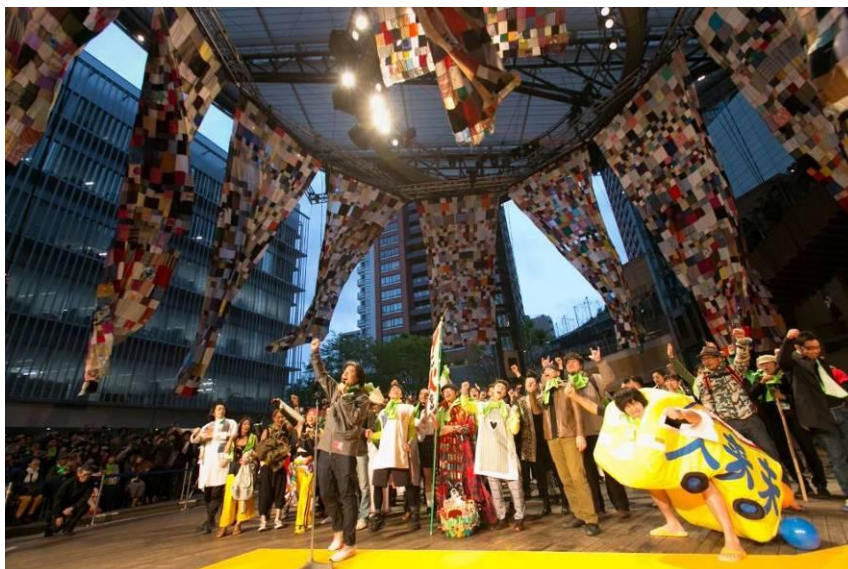
六本木アートナイト 2014の様子