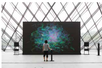
坂本龍一+真鍋大度「センシング・ストリームズー不可視、不可聴」 (札幌国際芸術祭2014)