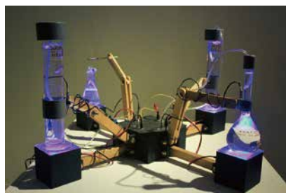
アンドレアス・シアギャン「Nalareksa 0.7」 (OK Video Festival, Galeri Nasional Indonesia, 2015)