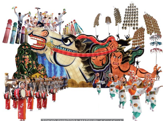
TOKYO SHINTORA MATSURI メインイベント

名称 : TOKYO SHINTORA MATSURI(東京 新虎まつり) 東北六魂祭パレード 日程 : 2016(平成28)年11月20日(日) 開催時間 : 1回目 10:15～、2回目 15:00～(予定) ※各回約80分予定 場所 : 環状第2号線 新虎通り(愛宕下通り～日比谷通り間) 出演団体 : 青森ねぶた祭、秋田竿燈まつり、盛岡さんさ踊り、山形花笠まつり、仙台七夕まつり(仙台すずめ踊り)、福島わらじまつり 料金 : 無料(事前応募・完全招待制)