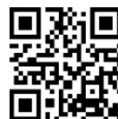
公式 HP QRコード

東京 新虎まつり公式 HP 内、東北六魂祭パレードページにある「応募フォーム」または、ハガキにて9月26日(月)よりご応募いただけます。詳細は公式 HP (www.shintora.tokyo)をご覧ください。