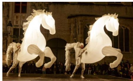
カンパニー・デ・キダム《FierS à Cheval～誇り高き馬～》