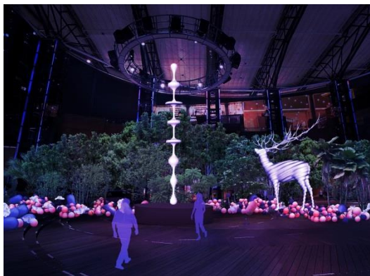
メインプログラム 六本木ヒルズアリーナ展開イメージ

内容：・実行委員長 南條史生による挨拶 ・メインプログラム・アーティスト 名和晃平による挨拶とメインプログラムの紹介 ・フォトセッション ・「カンパニー・デ・キダム」によるデモンストレーション ※プレスプレビュー終了後、囲み取材及び作品撮影のお時間を設けさせていただきます。