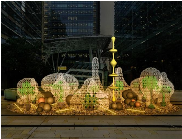
東京ミッドタウンでの展開イメージ