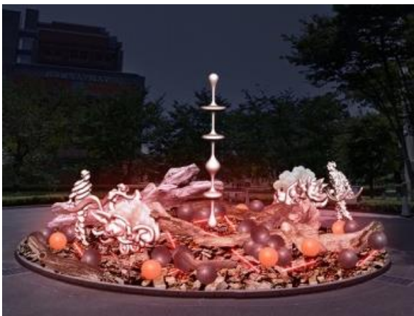
国立新美術館での展開イメージ

東京ミッドタウンでは、サボテンなどの多肉植物がバルーンオブジェに包まれて点在します。それらはまるで、バルーンの繭によって植物の生育を補助し再生を促す孵化装置のようでもあり、保育器(インキュベーター)で生気を取り戻すために、しばしの眠りにつく、小さくて未成熟な森の精霊達の安息地とも言えます。