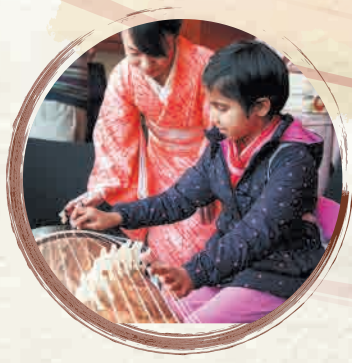
Experience playing a Koto 箏演奏体験の様子