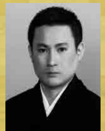
Satojiro Wakayagi 若柳里次朗