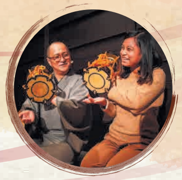
Experience hitting an Ohayashi Taiko (drums) お囃子体験の様子