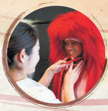
Experience wearing a wig かつら体験の様子