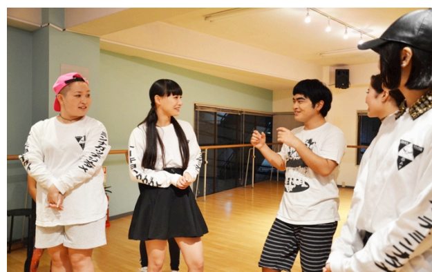
フラッシュモブ「まゆ毛太い」動画撮影の様子