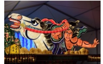
東京 新虎まつり 出陣ねぶた 風雲児信長(制作:柳谷優浩)

七夕祭りの灯籠流しが原型ともいわれる青森ねぶた祭。毎年250万人以上の人出で賑わう祭りは、国の重要無形文化財に指定されています。当パレードでは、特別に制作された幅6.5メートル、高さ4.5メートルのねぶたが出陣。迫力のねぶたが練り歩き、囃子方とハネトが渾然一体となり、秋の虎ノ門にその魂を鼓舞します。