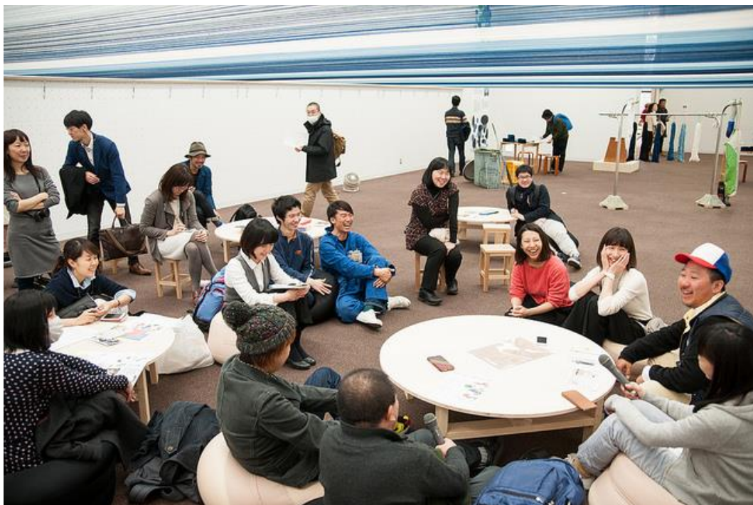
平成 27 年度「TURN フェス」の様子