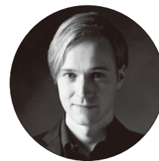
ヴィタリ・ユシュマノフ バリトン