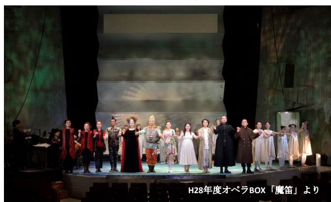
H28年度オペラBOX「魔笛」より

舞台制作の準備段階から関わることのできるワークショップ。 東京文化会館オペラBOXの制作現場で、 プロのスタッフのもと一緒に舞台を創り上げる貴重な機会です。