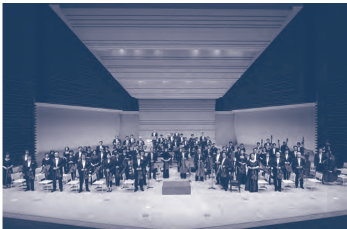
管弦楽 東京都交響楽団 Tokyo Metropolitan Symphony Orchestra

横浜生まれ。慶應義塾大学卒業後、テレビ朝日にアナウンサーとして入社し、各種スポーツ中継のほか『ニュースステーション』などで活躍。1995年にフリーとなつてからはテレビ・ラジオ・CMのほか、クラシック・コンサートの企画構成や司会でもコンサート・ソムリエとしてフィールドを広げている。とくに古楽とオペラではユニークな評論が注目を集めており、クラシックの語り部としても幅広く活躍中。日本ロッシェ二協会運営委員。