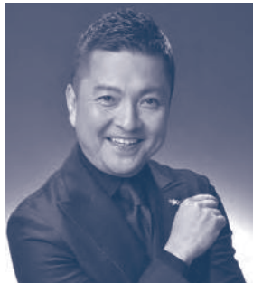
司会 朝岡 聡 あさおか さとし

ドイツ・マクデブルク劇場音楽総監督。これまでに、ベルリン・コミッシェ・オーパー首席カペルマイスター、大阪響首席客演指揮者などを歴任。ドレスデン・フィル、ボストン響室内管、N響、札幌などを指揮。幼少期を日本で過ごし、12歳で渡欧。ウィーン市立音楽院、ジュリアード音楽院でヴァイオリンの研鑽を積んだ後、指揮に転向。小澤征爾、サイモン・ラトルらに師事。2010年、『第9回齋藤秀雄メモリアル基金賞』指揮者部門受賞。