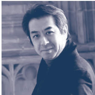
指揮 キンボー・イシイ

多摩と島しょ地域でオーケストラ公演やアンサンブル公演を開催。全て無料公演ですので、子供から大人までクラシック音楽をお気軽に楽しみいただけます。