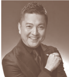
司会 朝岡 聡 あさおか さとし

ドイツ・マクデブルク劇場音楽総監督。これまでに、ベルリン・コミッシェ・オーパー首席カペルマイスター、大阪響首席客演指揮者などを歴任。ドレスデン・フィル、ボストン響室内管、N響、札幌などを指揮。幼少期を日本で過ごし、12歳で渡欧。ウィーン市立音楽院、ジュリアード音楽院でヴァイオリンの研鑽を積んだ後、指揮に転向。小澤征爾、サイモン・ラトルらに師事。2010年、『第9回齋藤秀雄メモリアル基金賞』指揮者部門受賞。