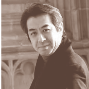
指揮 キンボー・イシイ

多摩と島しょ地域でオーケストラ公演やアンサンブル公演を開催。全て無料公演ですので、子供から大人までクラシック音楽をお気軽に楽しみいただけます。