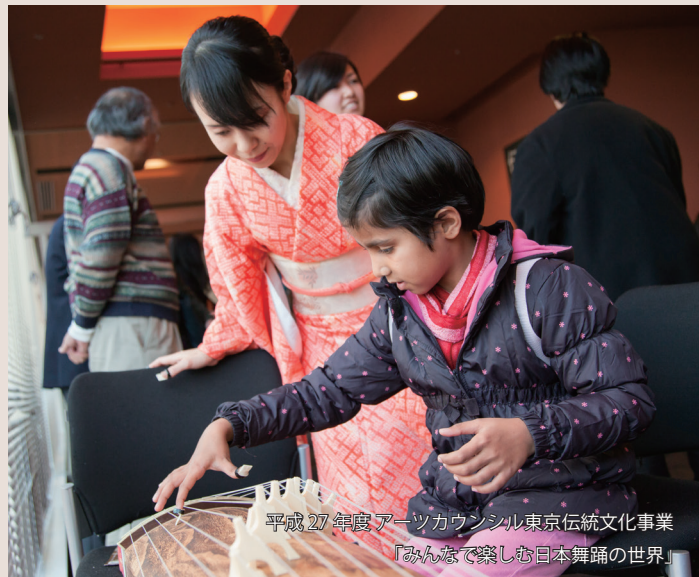
平成27年度アーツカウンシル東京伝統文化事業 「みんなで楽しむ日本舞踊の世界」

前半は日本の伝統楽器の箏、三味線、尺八の演奏を鑑賞し、後半は自ら“箏”の演奏にチャレンジします。演奏、体験指導はプロの実演家が行います。また、体験楽器の“箏”や演奏に使用する“箏爪”も用意して丁寧にわかりやすく指導するので誰でも気軽に参加する事ができます。短時間のイベントですが、和の雰囲気、心を味わう事ができるひと時になります。