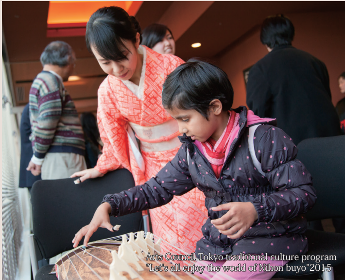
Arts Council Tokyo traditional culture program "Let's all enjoy the world of Nihon buyo" 2015

Listen to Japanese melodies and try your hand at playing the koto