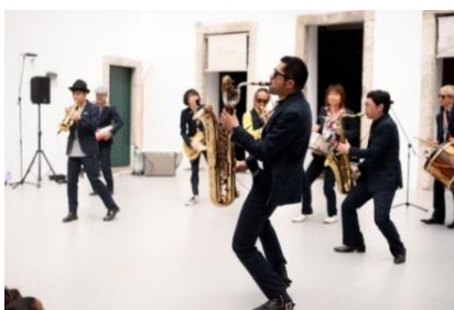
東京キャラバンin RIO（2016年）