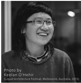
Photo by Keelan O'Hehir (Liquid Architecture Festival, Melbourne, Australia, 2015)