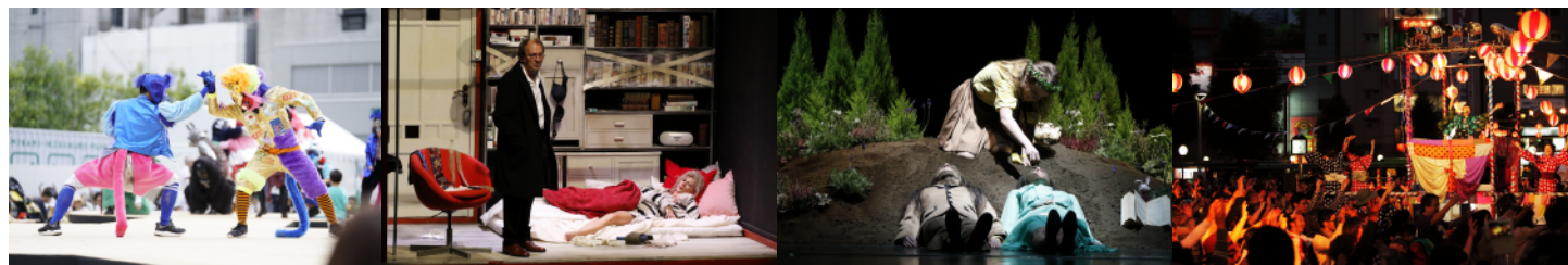
F/T17 『Toky Toki Saru(トキトキサル)』

昨年秋に開催されたF/T17は、F/T実行委員会、豊島区、公益財団法人としま未来文化財団、NPO法人アートネットワーク・ジャパン、アーツカウンシル東京・東京芸術劇場(公益財団法人東京都歴史文化財団)が主催し、文化庁による助成、多くの企業の支援のもと2017年9月30日(土) - 11月12日(日)までの44日間にわたり開催されました。2016年から東京芸術祭の一環として開催され、国内外の先鋭的なアーティストが集結し、都市型フェスティバルの可能性とモデルを更新するべく、新たな挑戦を続けています。