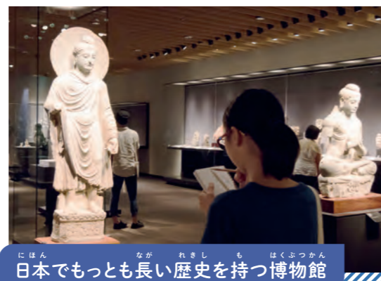
日本でもっとも長い歴史を持つ博物館