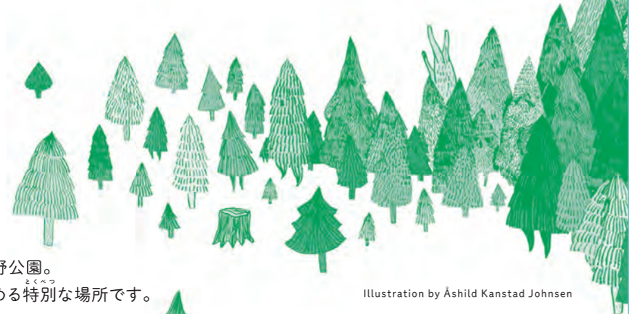
Illustration by Åshild Kanstad Johnsen

美術館や博物館、動物園や図書館、音楽ホールに芸術大学までそろっている上野公園。こんな場所、世界中のどこにもありません。ここは、こどもと大人と一緒に楽しめる特別な場所です。