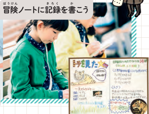
冒険ノートに記録を書こう