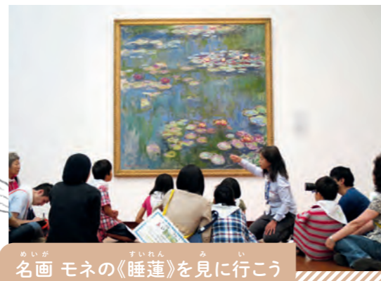
名画 モネの《睡蓮》を見に行こう