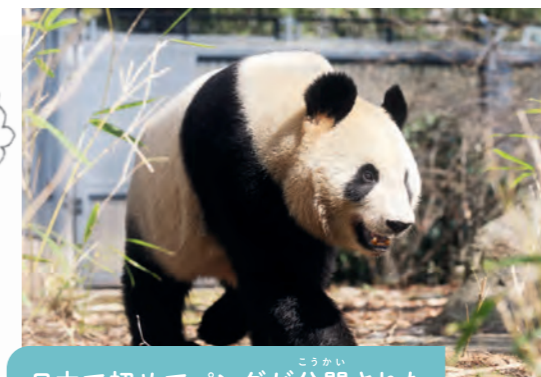
日本で初めてパンダが公開された