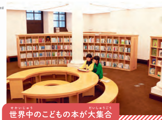
世界中のこどもの本が大集合