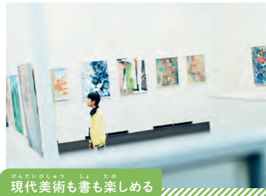
現代美術も書も楽しめる