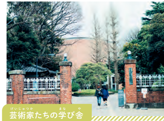
芸術家たちの学び舎