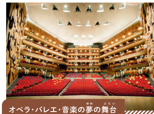
オペラ・バレエ・音楽の夢の舞台