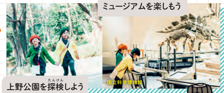
ミュージアムを楽しもう 上野公園を探検しよう 国立科学博物館