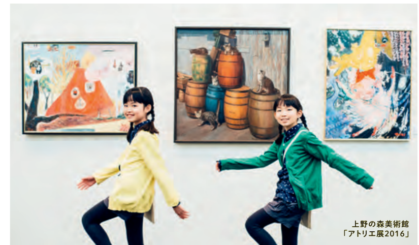
上野の森美術館 「アトリエ展2016」