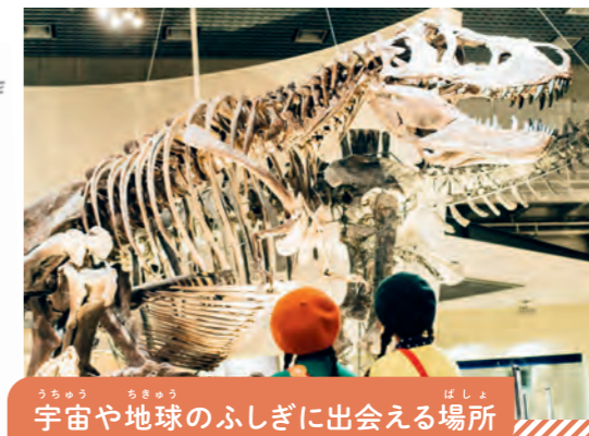
宇宙や地球のふしぎに出会える場所