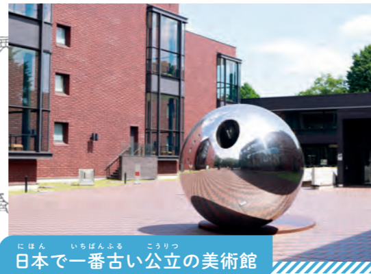
日本で一番古い公立の美術館