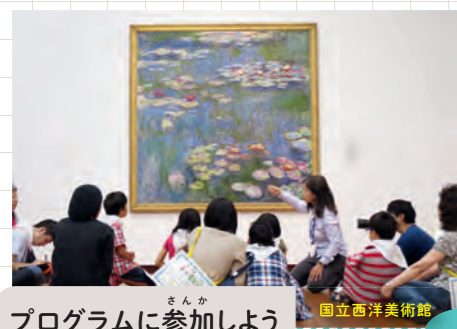
プログラムに参加しよう 国立西洋美術館