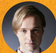
バリトン ヴィタリ・ユシュマノフ ♪