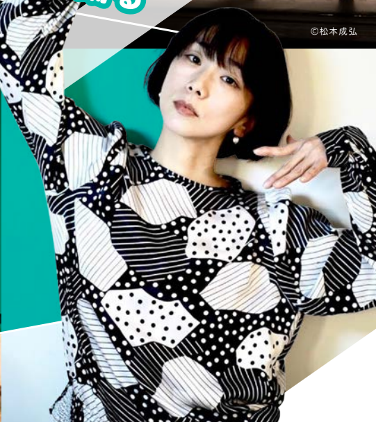
アーティスト 康本雅子 (振付家・ダンサー)