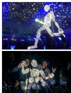
DUNDU by Tobias Husemann