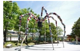
Louise Bourgeois's 1999 bronze sculpture Maman wrapped in fabric by Magda Seyeg in a temporary installation at Roppongi Hills, Tokyo, April-May 2018.