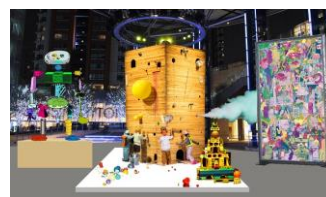
六本木ヒルズアリーナ 完成イメージ

六本木ヒルズアリーナでは、金氏 徹平による人間のようになり、踊り、一夜の夢を描きだすハイブリッドなコラージュ彫刻《タワー》が登場します。