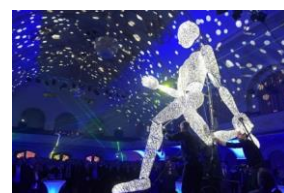
DUNDU by Tobias Husemann