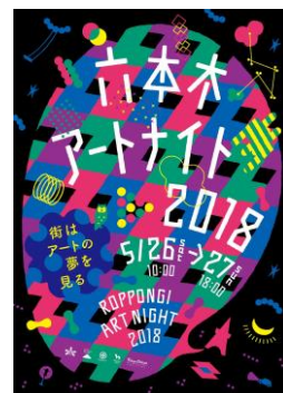
六本木アートナイト2018 メインビジュアル

公式サイト： http://www.roppongiartnight.com/ Facebook： https://www.facebook.com/RoppongiArtNight/ Twitter： https://twitter.com/r_artnight Instagram： https://www.instagram.com/roppongi_art_night_official/ ※ハッシュタグ：#roppongiartnight2018、#ran2018