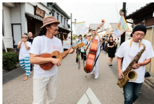
東京キャラバン in 熊本(2017年)