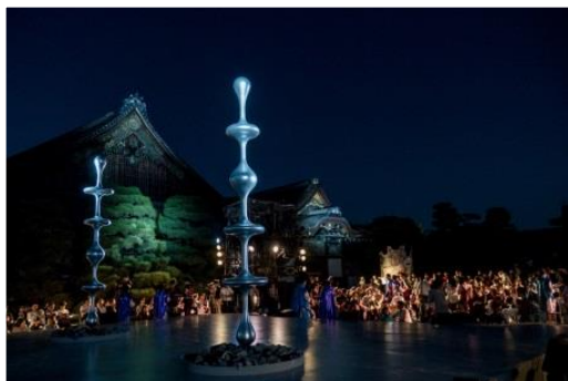
東京キャラバン in 京都(2017年)