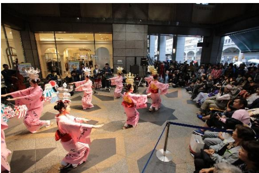
東京キャラバン in 熊本(2017年)