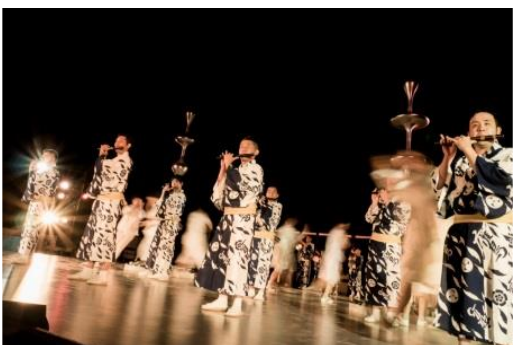
東京キャラバン in 京都(2017年)