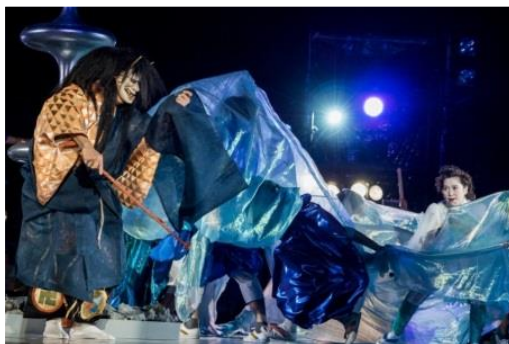
東京キャラバン in 京都(2017年)