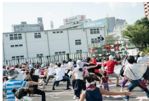
東京キャラバン in 八王子(2017年)