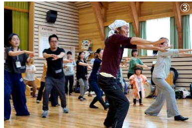
①2017年「東京キャラバンin熊本」 ②③「東京キャラバンin豊田」創作ワークショップ（②GIANT STEPSと棒の手 ③近藤良平の振付を踊る参加者）