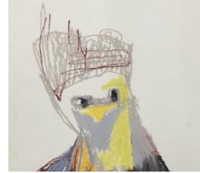
日比野克彦、『キグネ』、2014年