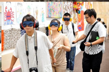
「TURN フェス 3」(2017 年)の様子

TURN とは、障害の有無、世代、性、国籍、住環境などの背景や習慣の違いを超えた多様な人々の出会いによる相互作用を、表現として生み出すアートプロジェクトの総称です。平成 29 年度より、東京 2020 公認文化オリンピックアードとして実施しています。