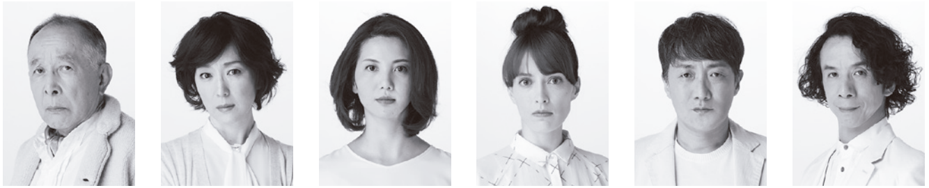
橋爪功 Isao Hashizume