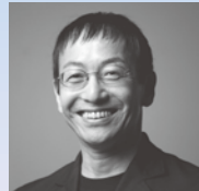
野田秀樹 談 (劇作家・演出家・役者)

インターネット でのライブ中継 実施決定! 「東京キャラバン in 秋田」パフォーマンスを より多くの皆さまにご覧いただくため、 公式WEBサイトにインターネット ライブ中継いたします。詳しくは WEBサイトをご覧ください。 http://tokyocaravan.jp