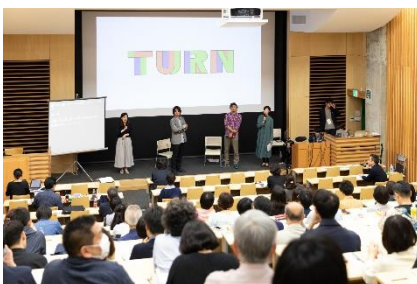
第5回 TURN ミーティング (2018年5月)