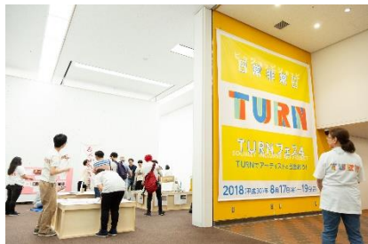
TURN フェス4会場風景 会場入り口