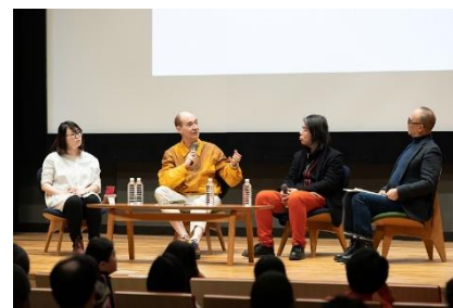
第7回 TURN ミーティング (2019年2月)