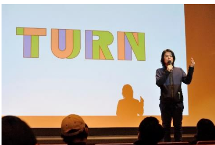
第4回 TURN ミーティング (2018年1月)