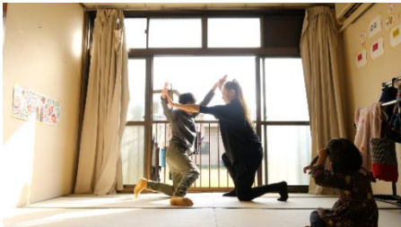
森山開次と金町学園

アーティストが、福祉施設や社会的支援を必要とする人の集うコミュニティへ赴き、その場所を利用する人や支援者等との交流を重ね、相互に関係しあうプロセスを構築します。