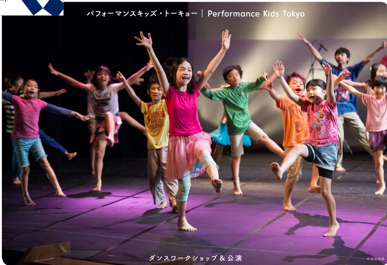
ダンスワークショップ & 公演