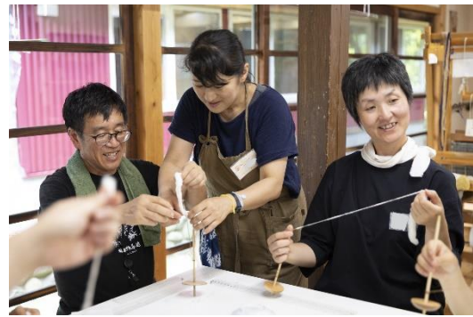
TURN LAND (クラフト工房 La Mano)