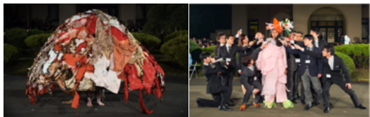
「writtenafterwards」2018年春夏コレクションより

《「writtenafterwards」ファッションショー》 ※11月9日(土)17:00～