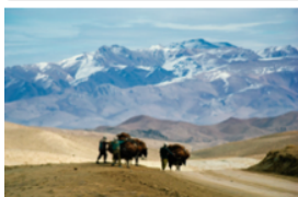
篠山紀信「シルクロード」より

テーマ“FLOATING NOMAD”と交易路を行き交う人々のイメージが重なり合う特別展示 《篠山紀信「シルクロード」写真展》