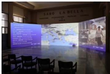
Manifesta 12 Casa del Mutilato, Palermo 2018より

東京都台東区生まれ、谷中育ち。美術評論家、キュレーター。パリ国立高等美術学校講師・客員教授、ニューヨーク大学客員研究員。5年間メルシャン軽井沢美術館チーフ・キュレーター、12年間武蔵野美術大学教授を務めた後、現在、パリ日本文化会館展示部門アーティストティック・ディレクター。