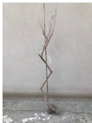
< Tutor >