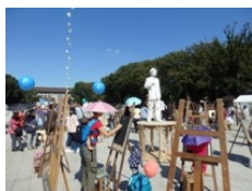
2018年実施の野外写生大会「スタチュー写真大会」より

昨年度大好評の野外写生大会がバージョンアップして登場 《「coconogacco」野外ワークショップ》