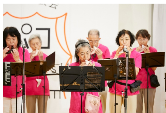
「第 5 回トパコ」の様子

東京都及び公益財団法人東京都歴史文化財団 アーツカウンシル東京は、12 月 7 日(土)に「第 7 回トパコ(都民パフォーマーズコーナー)」を開催します。