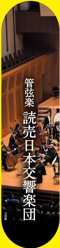
管弦楽 読売日本交響楽団