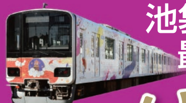
「池袋・川越アートトレイン」

JR・東京メトロ・東武東上線・西武池袋線 池袋駅西口より徒歩2分。池袋駅地下通路2b出口直結。