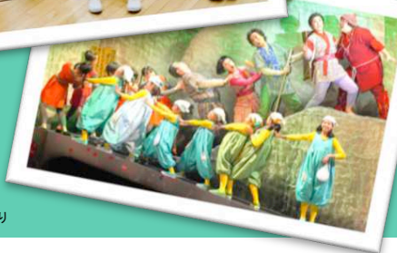
*平成31年度「オペラをつくろう！」より