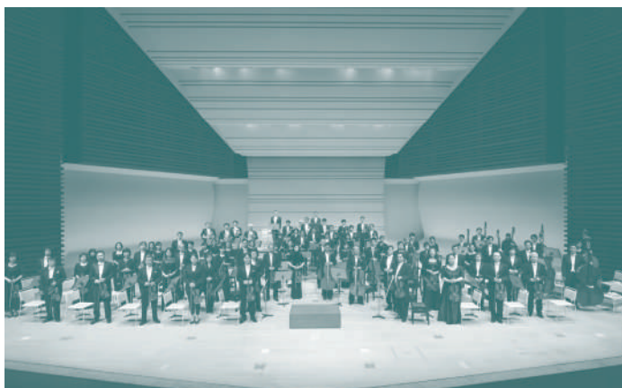
管弦楽 東京都交響楽団

横浜市生まれ。慶應義塾大学卒業。テレビ朝日にアナウンサーとして入社し、各種スポーツ中継のほか『ニュースステーション』初代スポーツ・キャスターとして活躍。1995年フリーとなってからはテレビ・ラジオ・CMのほか、クラシック・コンサートの企画構成や司会でもコンサート・ソムリエとして活動のフィールドを広げている。とくにオペラと古楽ではユニークな評論が注目を集めており、クラシックの語り部としても幅広く活動中。