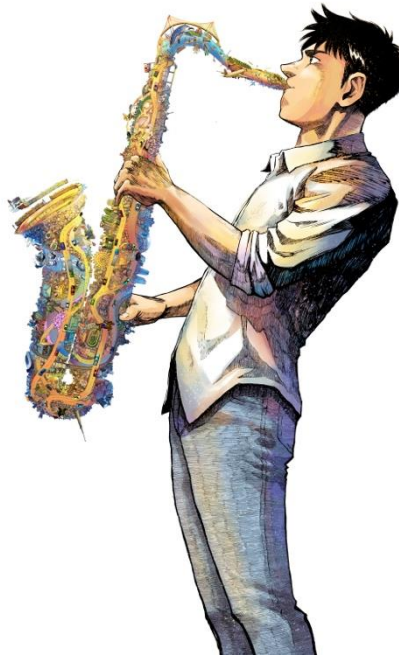
『Tokyo Sound』より ©石塚真一