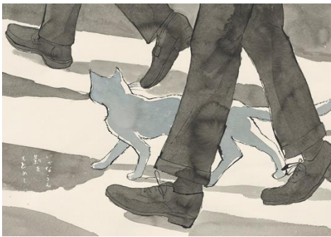
『東京の青猫』より ©松本大洋