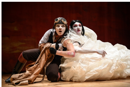
『The Scarlet Princess』（2018年）