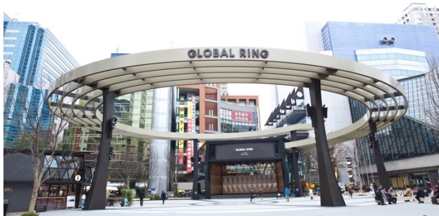
GLOBAL RING THEATRE (グローバルリング シアター)

街の只中で、夕景から夜に掛かる時間、喧騒さえも芝居の一部になる都会の野外劇。その異空間をご堪能ください。