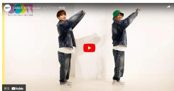
TOMO、YORI によるレクチャー映像

さらにダンスを学ぶ方向けのプログラムとして、プロのダンサーによる本格的なオンラインワークショップを、SSDW 公式 YouTube チャンネルで11月20日(日)より配信いたします。