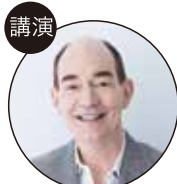
ロバート キャンベル