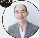
ロバート キャンベル