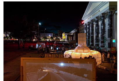
《蚊帳の外》栗林隆+Cinema Caravan、ドクメンタ15 (ドイツ・カッセル)、フリデリツィ広場