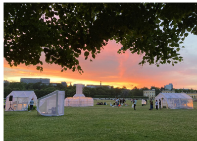
《蚊帳の外》栗林隆+Cinema Caravan、ドクメンタ15 (ドイツ・カッセル)、カールスアウエ、photo Takashi Kuribayashi