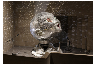
《アースベイビー》2009年