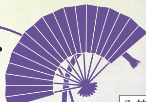
神楽坂タイムスリップ スタンブラー／歴史ガイド