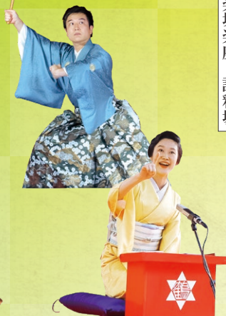
神楽坂楽座〜講釈場