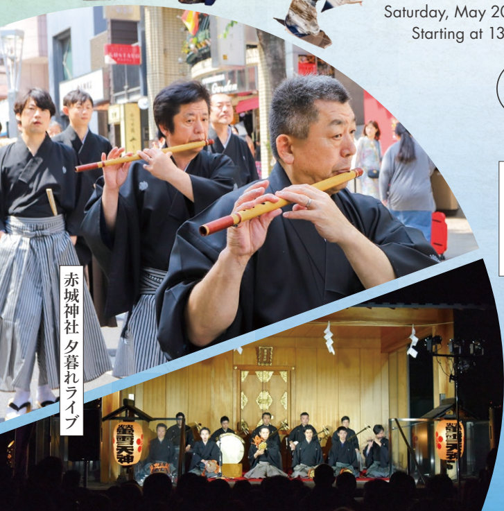
赤城神社夕暮れライブ