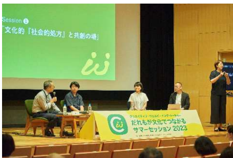
トークセッションの様子