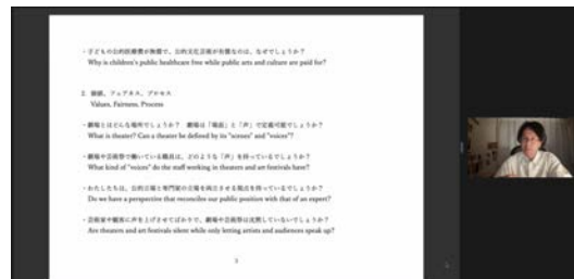
東京芸術祭ファーム 2023 ラボ 公開レクチャー 「舞台芸術と社会——価値、フェアネス、プロセス」 8月23日(水) オンライン