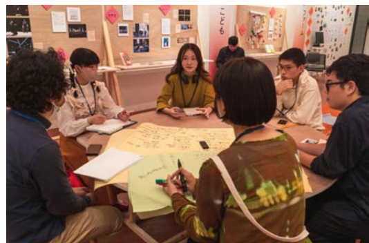
東京芸術祭ファーム 2023 スクール： 学生トークサロン 10月11日(水)、15日(日)、22日(日) 東京芸術劇場 ロワー広場/東京芸術祭ひろば