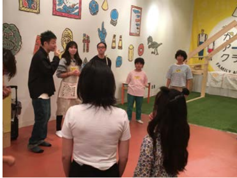
アトカル・マジカル学園 かぞくアートクラブ 10月14日(土)、15日(日)、21日(土)、 22日(日) 東京芸術劇場 アトリエウエスト